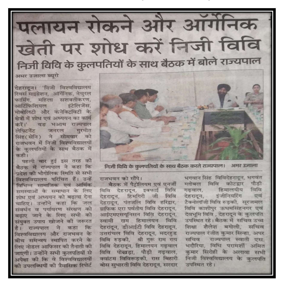
Pic.2: A news clip of the meeting in Raj Bhavan, Dehradun of Uttarakhand state along with the Hon. Governor of the state on 25th April, 2022 at 11AM to 4 PM